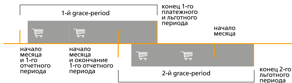
Схема льготного периода

Отчетный период — это период, в течение которого держатель карты совершает покупки. По истечении отчетного периода банк определяет сумму задолженности.